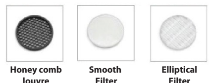
Honey comb louver