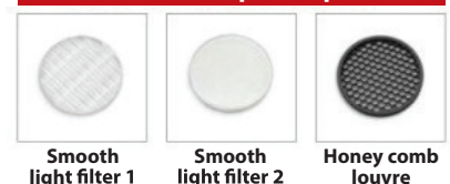
Smooth light filter 1