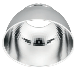
60° beam angle UGR<19