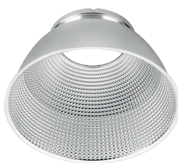
90° beam angle UGR<21